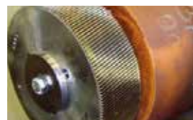
Korrosion des Verdichter-Gehäuses