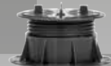
PB-2 60>90 mm